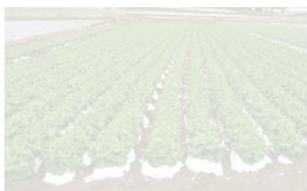
マルチ(ツインホワイト)