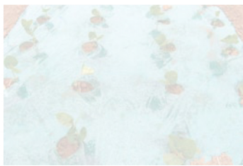
マルチ(アザヤカグリーン)